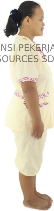
AGENSI PEKERJAAN TC RESOURCES SDN BHD