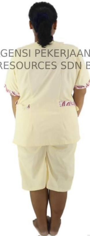
AGENSI PEKERJAAN TC RESOURCES SDN BHD