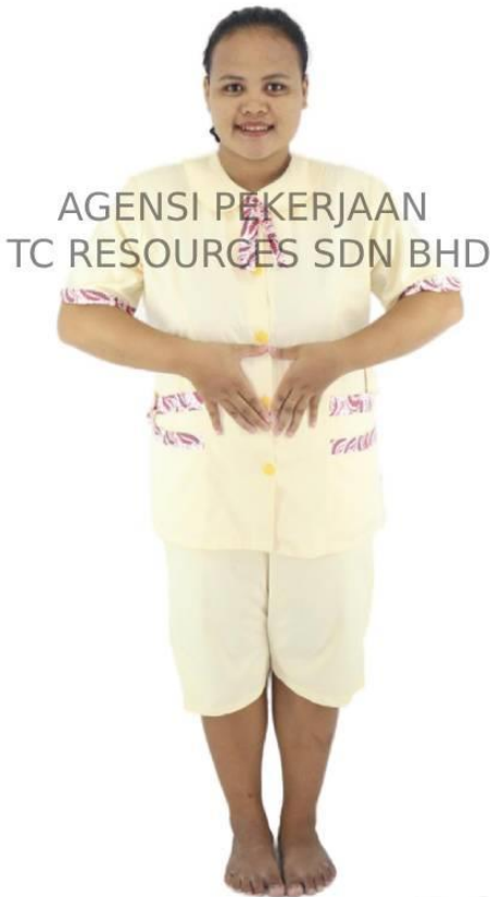
AGENSI PEKERJAAN TC RESOURCES SDN BHD